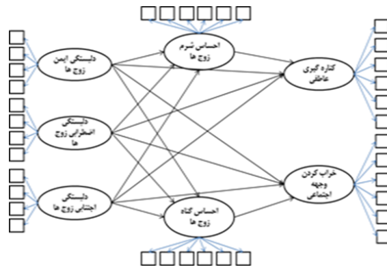
شکل ۱. الگوی پیشنهادی پژوهش